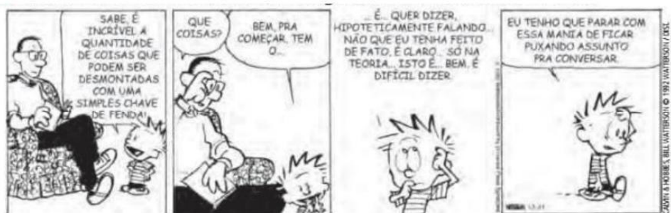
Bill Watterson. O melhor de Calvin. Quadrinhos. O Estado de S. Paulo. 6 ago. 2017. C4. Caderno 2.

6. Calvin é um menino arteiro, inteligente e muito inventivo. Leia.